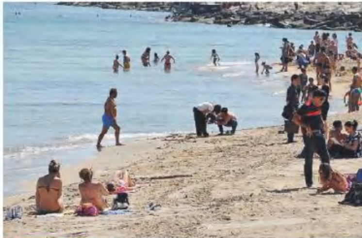
DOMENICA DI SOLE A Bari tanta gente sulla spiaggia pubblica