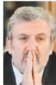
PRESIDENTE Michele Emiliano

Benvenuti in Puglia, la terra del mare e del sole. L'unico posto del mondo in cui l'estate arriva, per legge, il 1° maggio e finisce, sempre per legge, il 30 settembre. Fa caldo? Pazienza. Dovrebbero mettere un asterisco su tutti i siti del mondo: attenzione, nel mare pugliese si può fare il bagno per 150 giorni